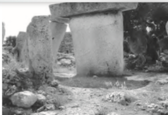
↑ Monumento funerario de la cultura Talayótica, Mallorca, España.

a.- ¿Qué muestra cada una de las imágenes?